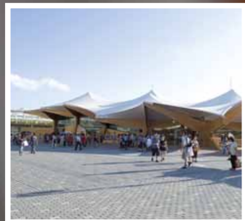
Expo i tre. Norges stand på Expo 2010 i Shanghai ble laget i tre og utformet som 13 individuelle trær som ble satt sammen. Den gjenbrukbare standen er tegnet av arkitektfirmaet Helen & Hard.

– Få materialer kan måle seg med tre. Miljøaspektene alene er grunn nok til å velge tre. At tre også er vakkert å se på, lukter godt, er godt å ta på, absorberer lyd og oppleves som varmt, påvirker